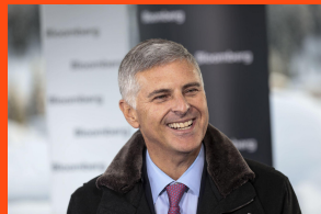
Christopher J. Nassetta CEO Hilton hotels