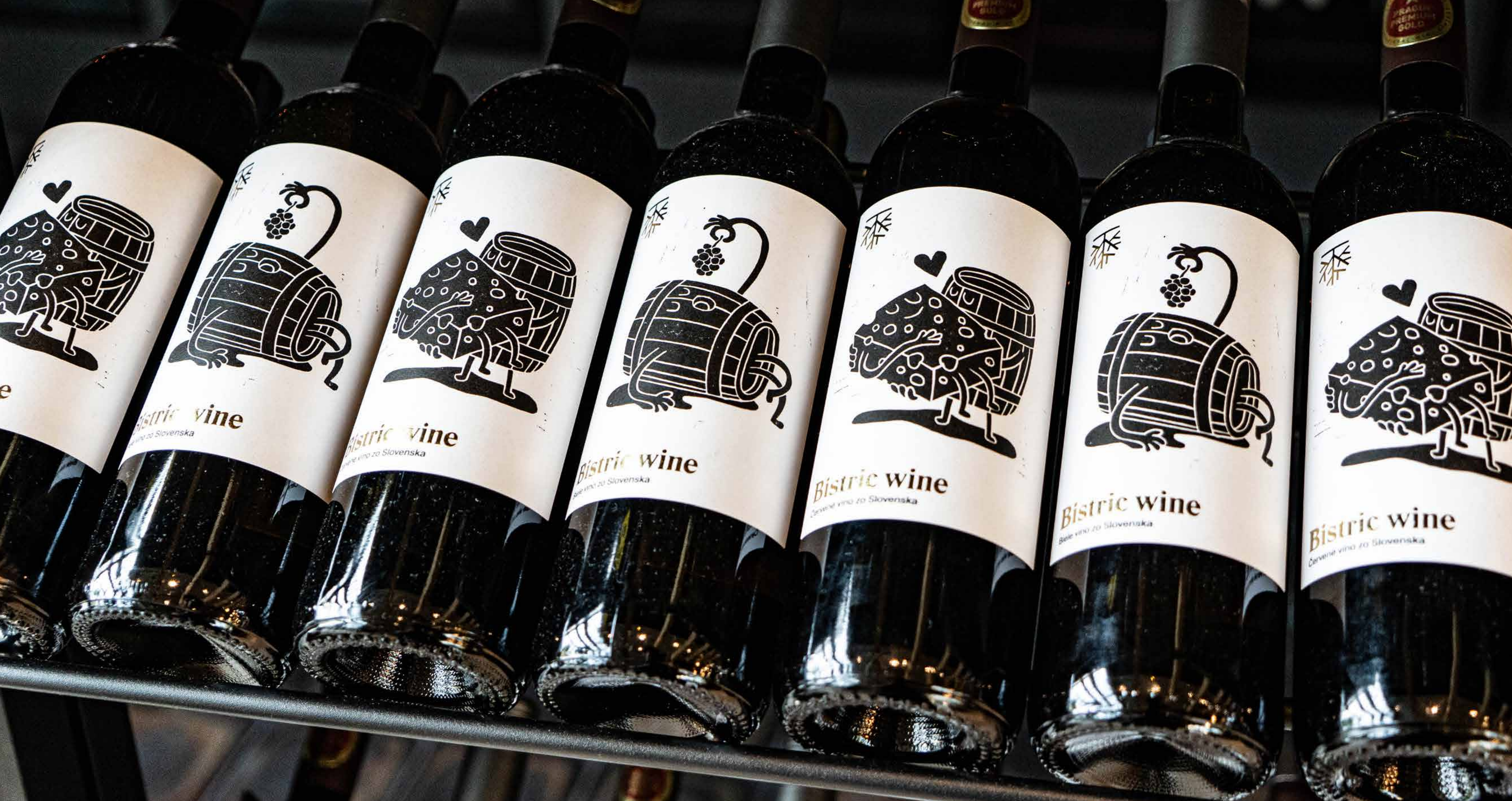
Etikety pre vino di casa