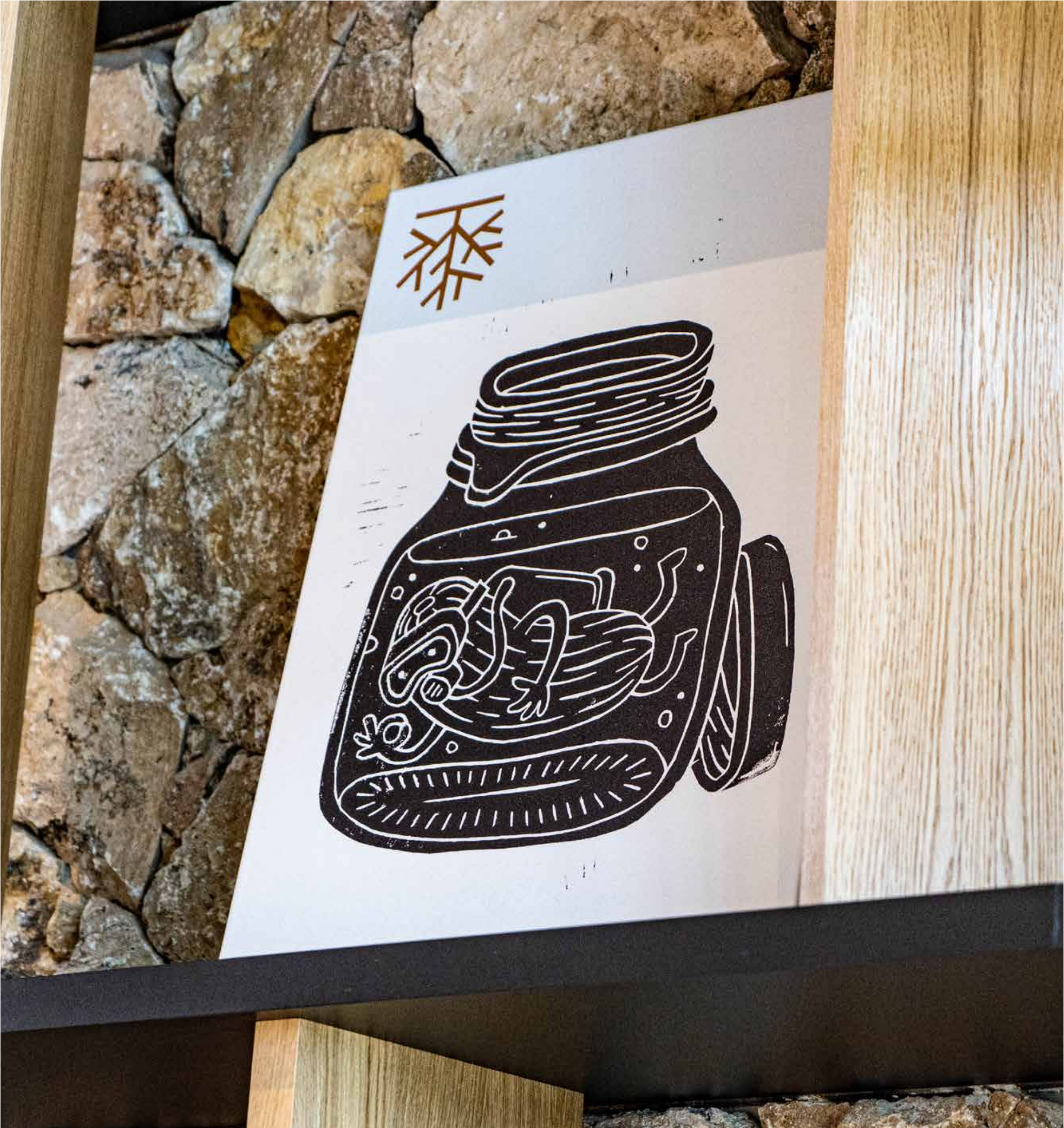
Menu a obrazy v interiéri