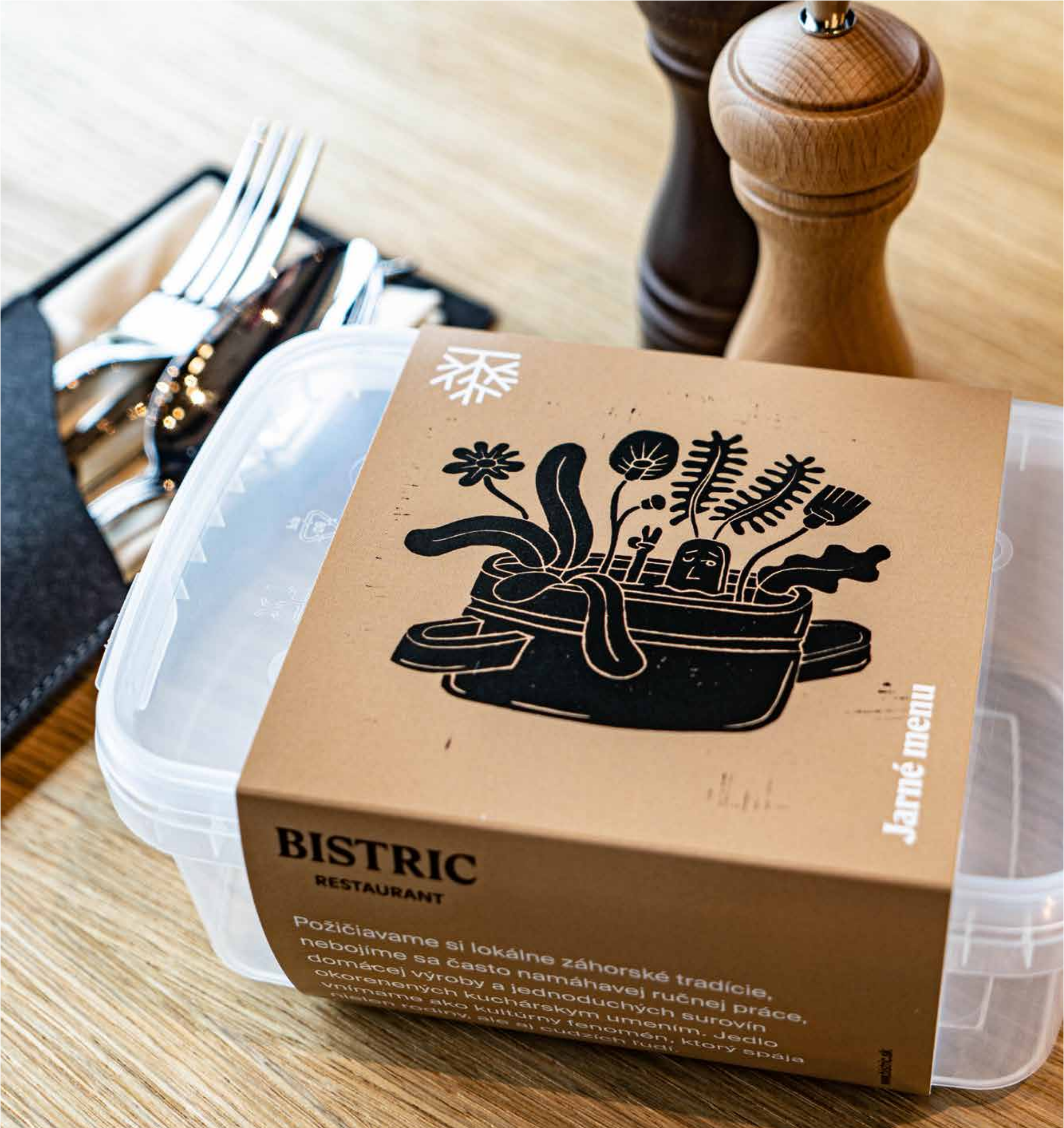
Podložky pod poháre a take-away box.