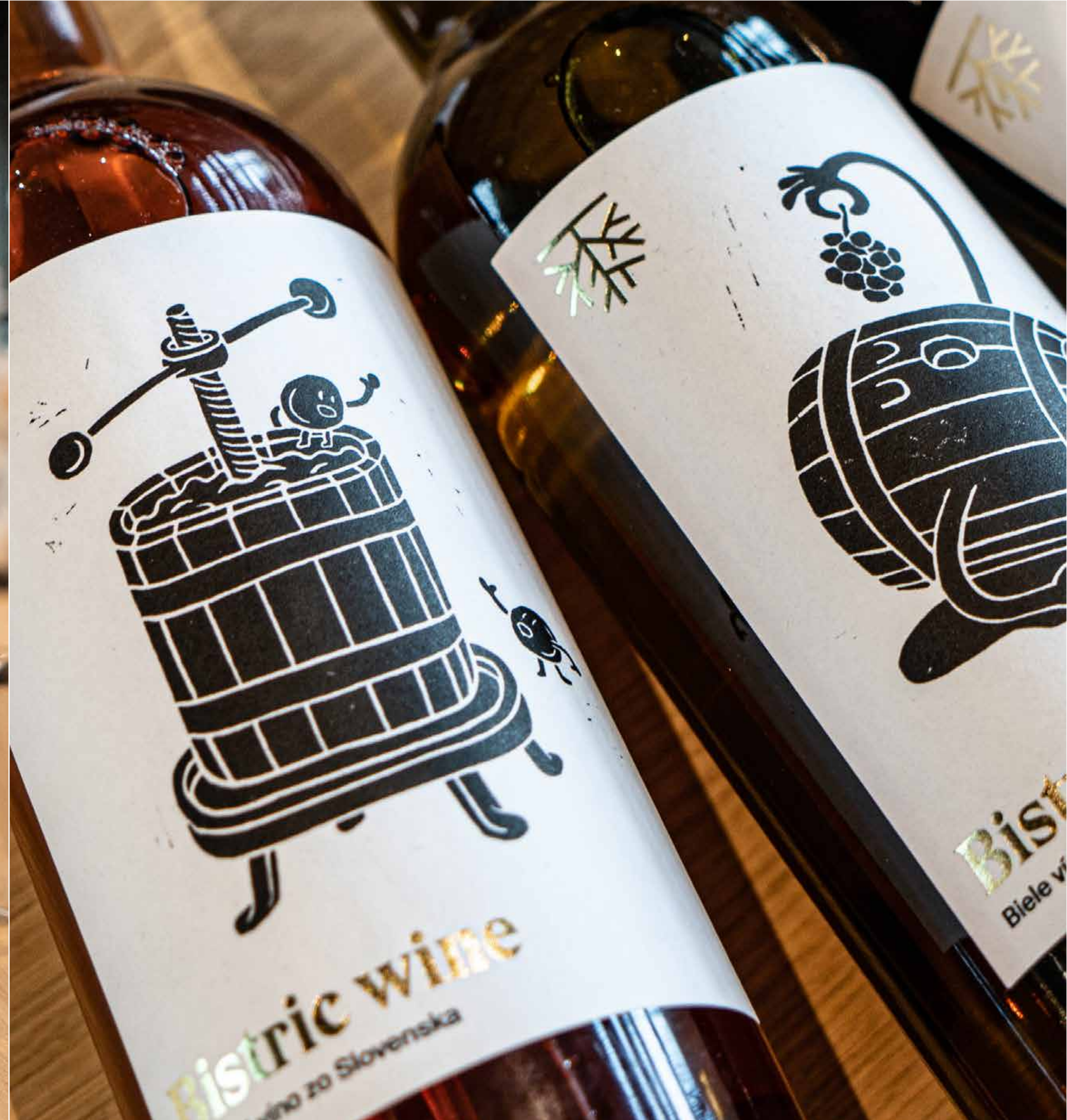
Etikety pre vino di casa