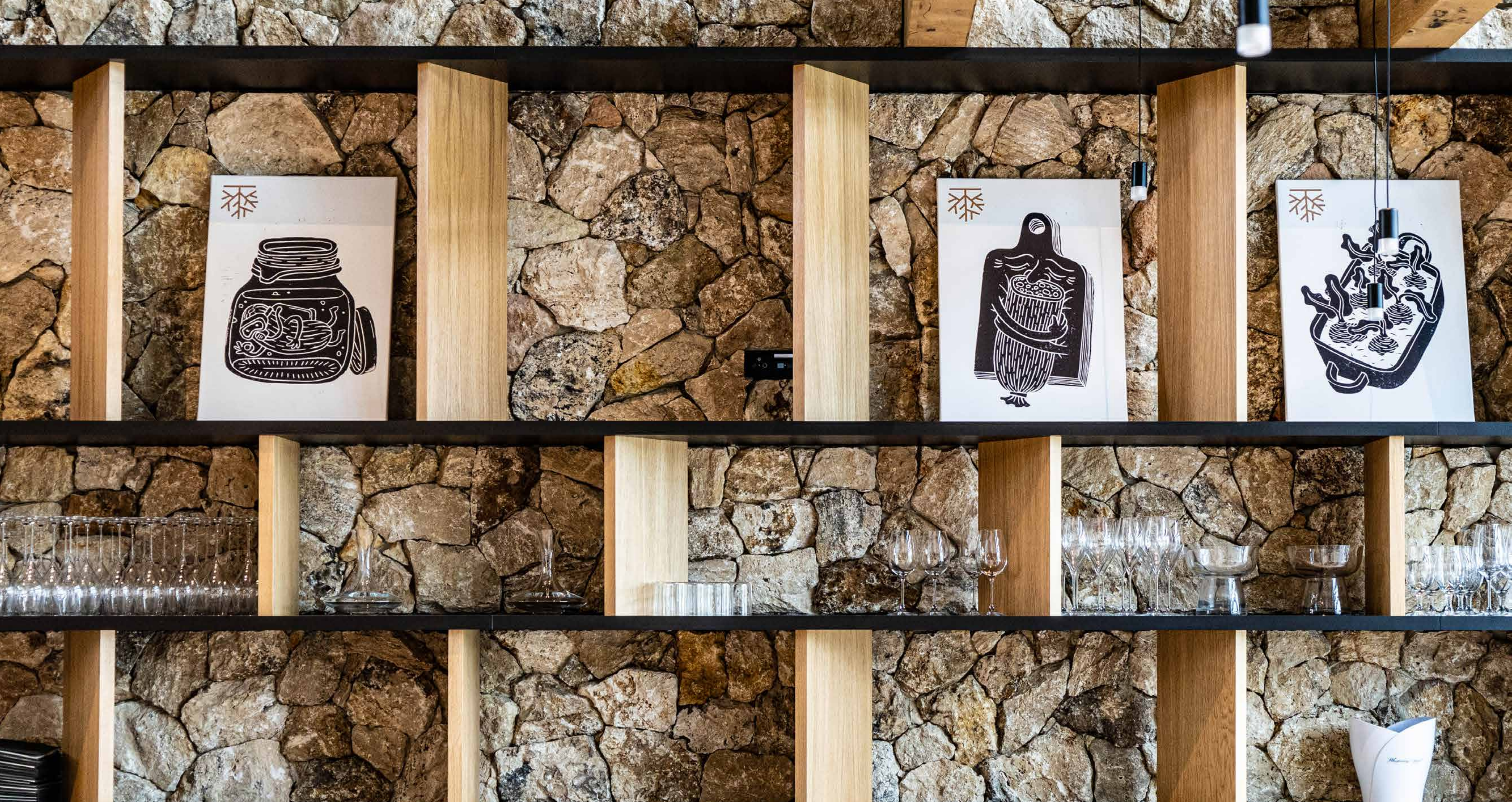
Obrazy v interiéri