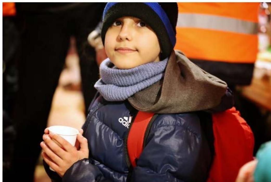
Hasan na hraničnom priechode Vyšné Nemecké.