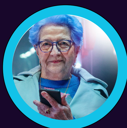
Blue Grandma Ľudia každého veku