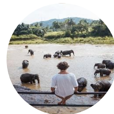
Patrik Paulínyi Fotografia a video