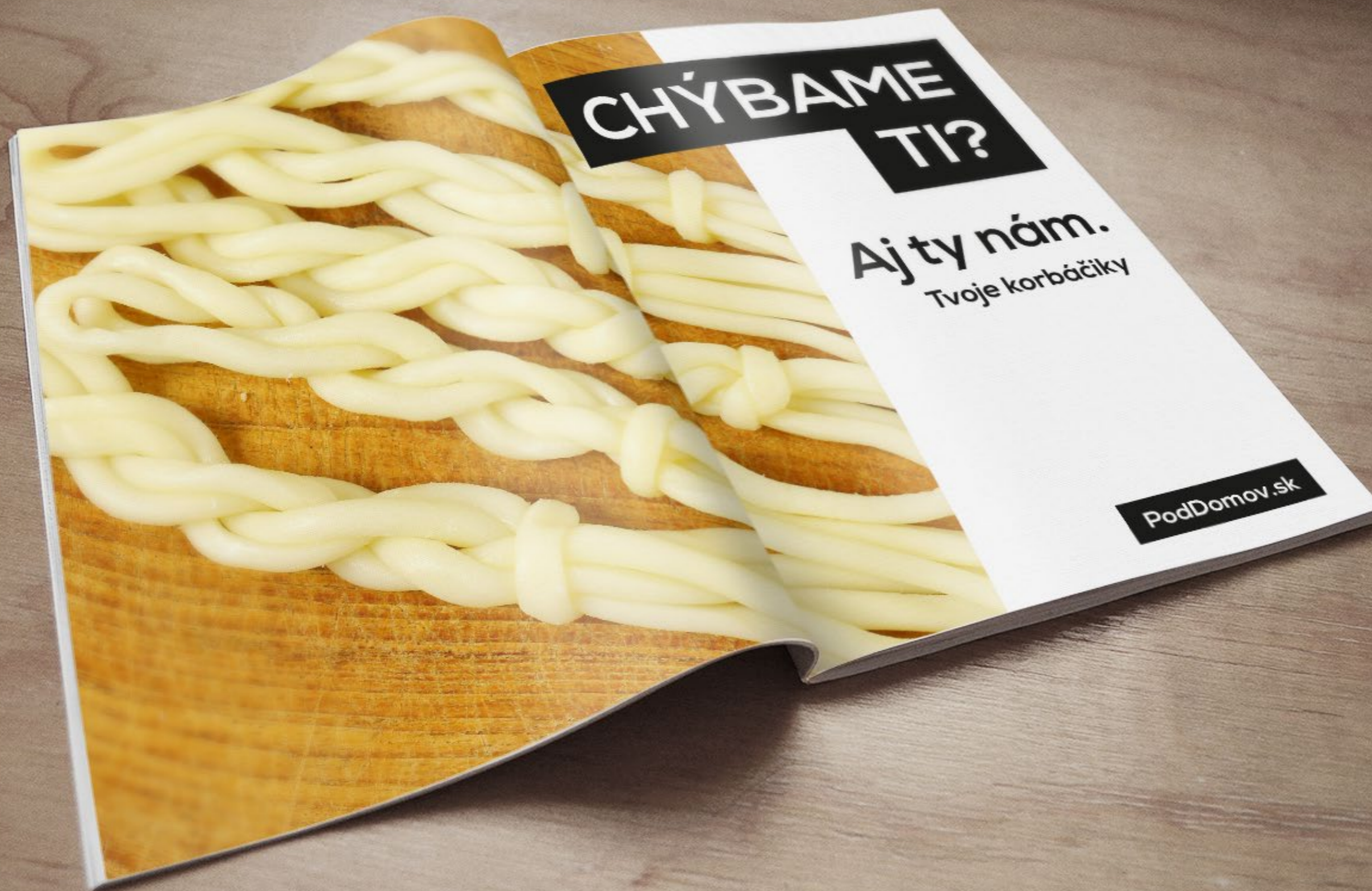
Dvojstrana v zahraničnom časopise (USA, Kanada, Austrália, Veľká Británia)