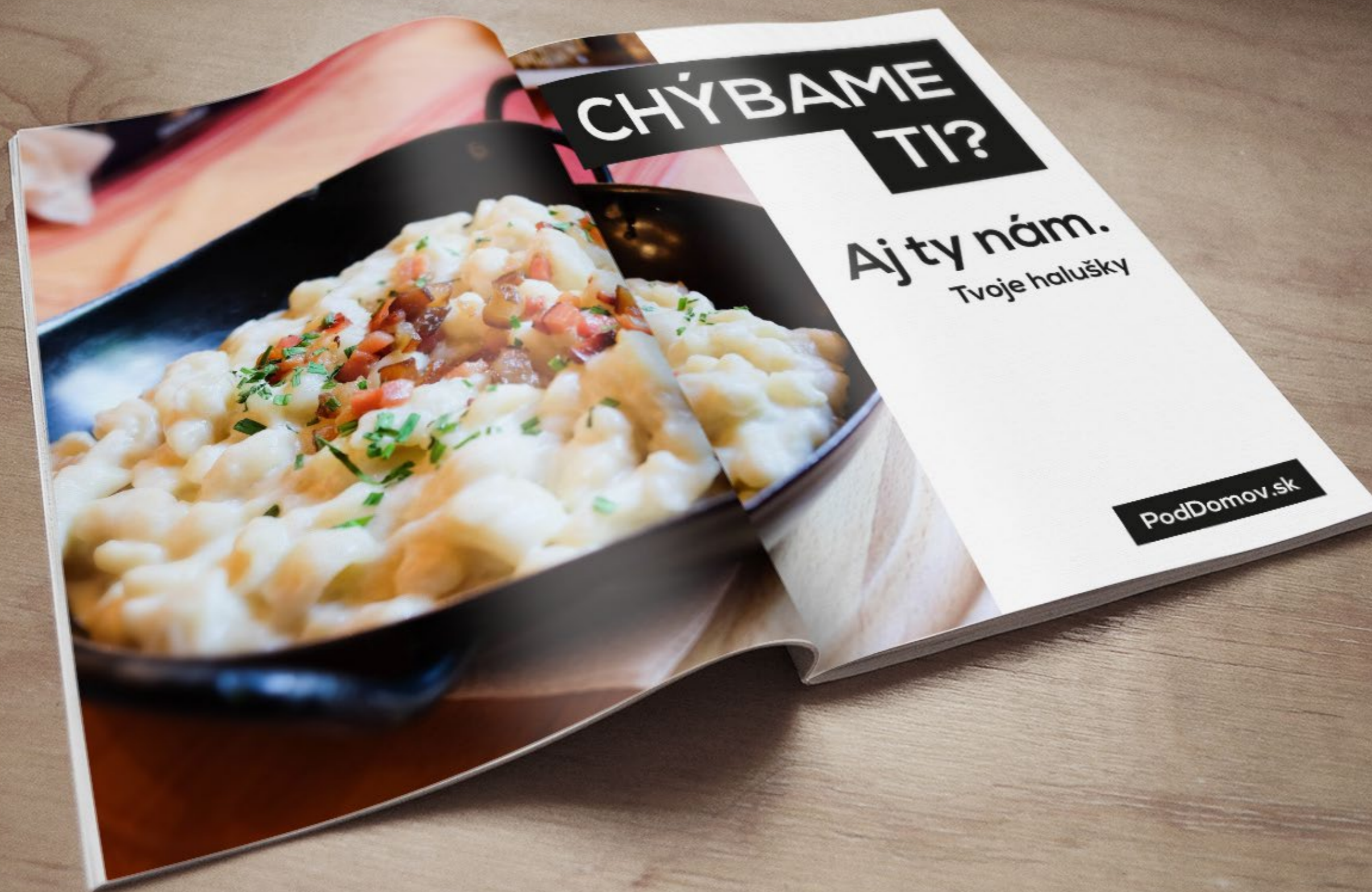
Dvojstrana v zahraničnom časopise (USA, Kanada, Austrália, Veľká Británia)