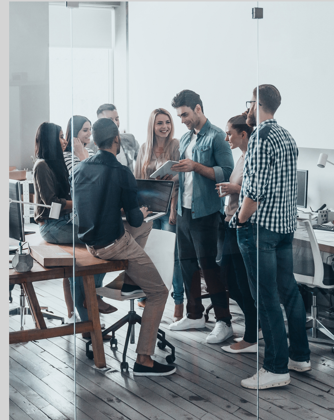
● Lorem ipsum dolor sit amet