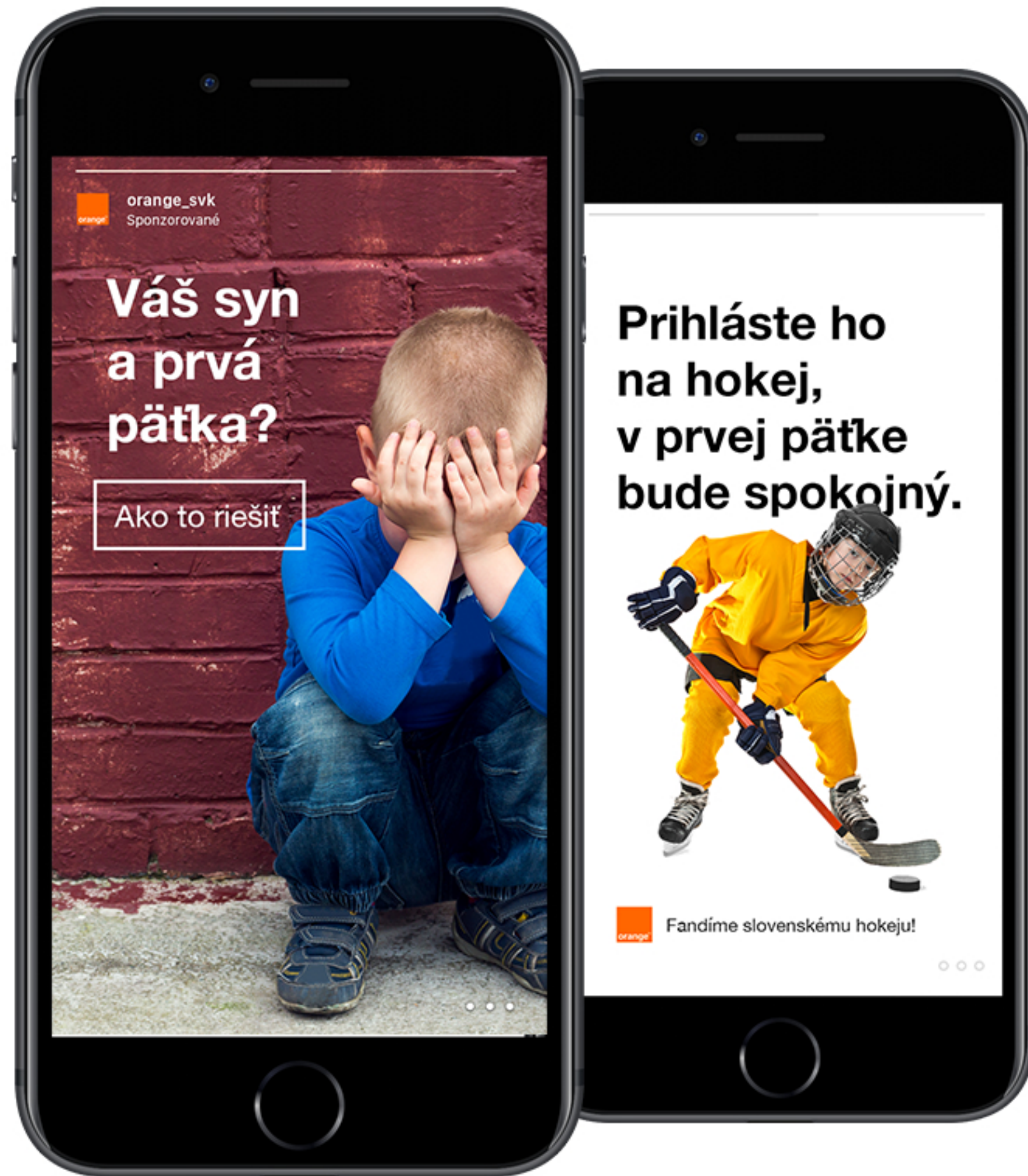
Sponzorovaná Instagram Story A