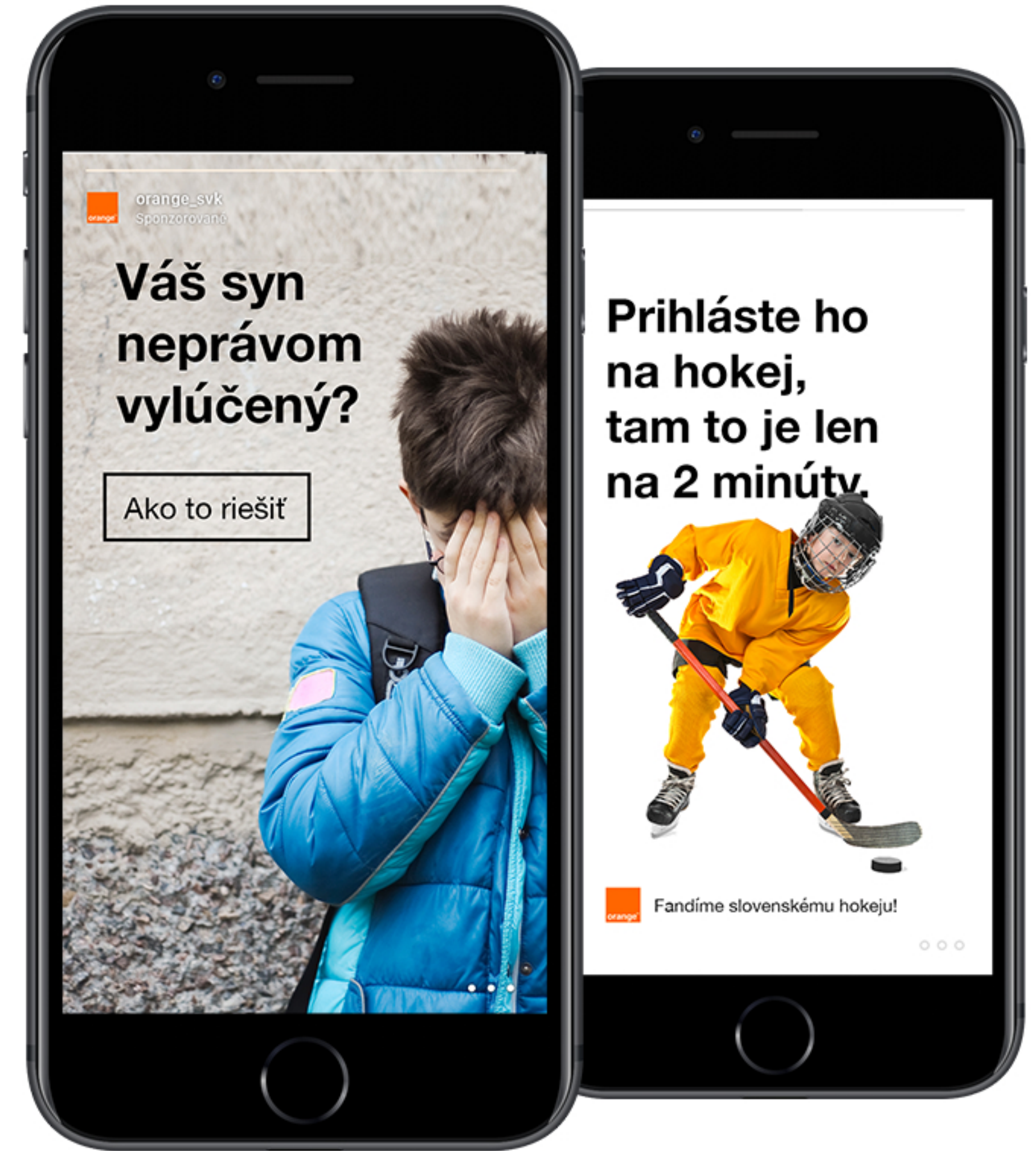
Sponzorovaná Instagram Story A